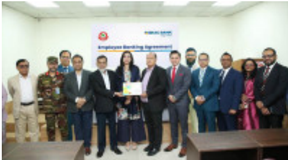
বিআরটিসিকে এক্সক্লুসিভ এমপ্লয়ি ব্যাংকিং সুবিধা দেবে ব্র্যাক ব্যাংক (https:// banglanews24.com/corporatecorner/news/bd/1445059.details)