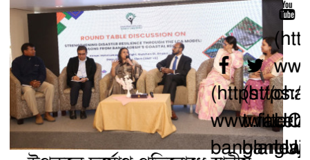
উপকূলে দুর্যোগ প্রতিরোধে স্থানীয় সমাধান নিয়ে গোলটেবল

বাংলাদেশের সাসটেইনেবল ডেভেলপমেন্ট গোলস (এসডিজি) বা টেকসই উন্নয়ন লক্ষ্যমাত্রা অর্জনের যাত্রায় গুরুত্বপূর্ণ ভূমিকা পালন করছে ইউনিলিভার বাংলাদেশ। বাংলাদেশের পরিবেশের জন্য প্লাস্টিক বর্জ্য ব্যবস্থাপনা একটি স্পর্শকাতর চ্যালেঞ্জ হওয়ায় ইউবিএল ভবিষ্যতেও কার্যকরী অংশীদারিত্বমূলক উদ্যোগ গ্রহণ অব্যাহত রাখবে। বাংলাদেশে প্লাস্টিক বর্জ্য ব্যবস্থাপনার ভ্যালু চেইনে অগ্রগামী প্রতিষ্ঠানগুলোর মধ্যে একটি