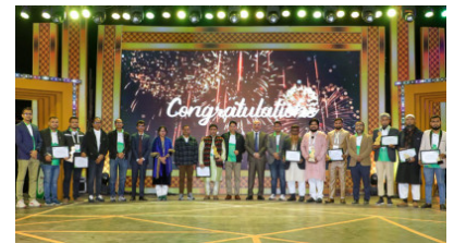
কক্সবাজারে ওয়ালটন ও সেইফ ইলেকট্রিক্যাল অ্যাপ্লায়েন্সের বার্ষিক ডিস্ট্রিবিউটর কনফারেন্স

(https://banglanews24.com/corporatecorner/news/bd/1445059.details)