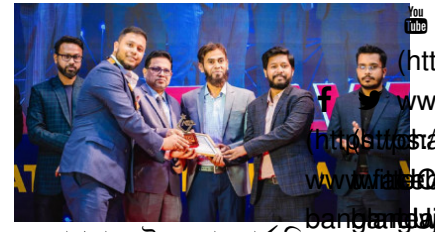
ন্যাশনাল টেক অ্যাওয়ার্ড জিতল English (https://banglanews24.com/english) ইজিড্রপ

(https://banglanews24.com/ corporatecorner/news/ bd/1444357.details)