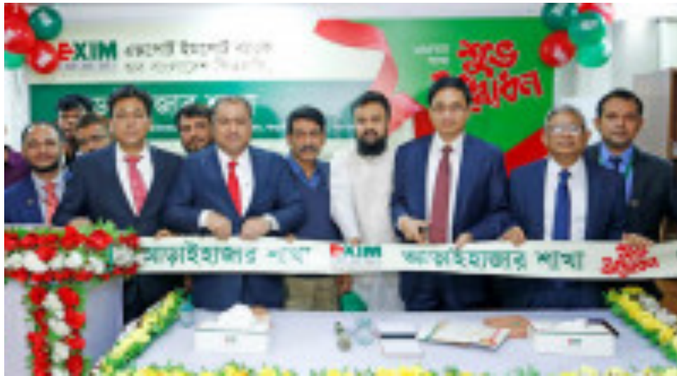
আড়াইহাজারে এক্সিম ব্যাংকের ১৫৫তম শাখা উদ্বোধন (https:// banglanews24.com/corporatecorner/news/bd/1445068.details)

সার্চ ইউনিজয় ফনেটিক - "https://144357.details"