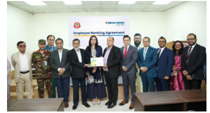
বিআরটিসিকে এক্সক্লুসিভ এমপ্লয়ি ব্যাংকিং সুবিধা দেবে ব্র্যাক ব্যাংক

(https://banglanews24.com/corporatecorner/news/bd/1445068.details)