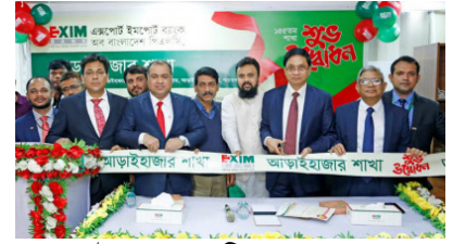
আড়াইহাজারে এক্সিম ব্যাংকের ১৫৫তম শাখা উদ্বোধন

(https://banglanews24.com/corporatecorner/news/bd/1445110.details)