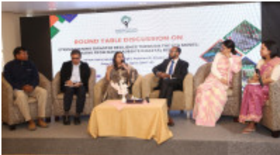
ইউনিভার্সাল বাংলাদেশে শীতবস্ত্র বিতরণ করা হচ্ছে (https://

কর্পোরেট কর্নার বিভাগের সর্বোচ্চ পঠিত ( https://banglanews24.com/category/কর্পোরেট কর্নার/1259 )