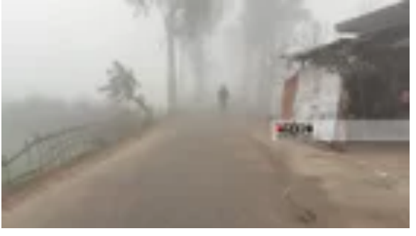
পঞ্চগড়ে বইছে মৃদু শৈত্যপ্রবাহ, তাপমাত্রা ৯ ডিগ্রিতে জাতীয়