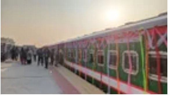
খুলনা-ঢাকা রুটে 'জাহানাবাদ এক্সপ্রেস' ট্রেনের.. জাতীয়