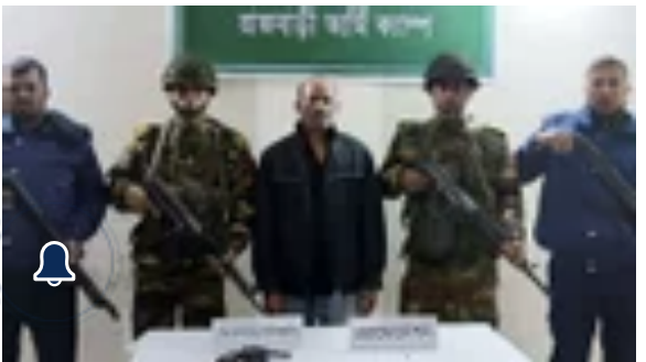
রাজবাড়ীতে বিদেশী অস্ত্রসহ একজন গ্রেফতার জাতীয়