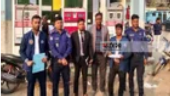
বিএসটিআই এর অনুমোদন বিহীন লোগো ব্যবহার করায় কারাদণ্ড জাতীয়