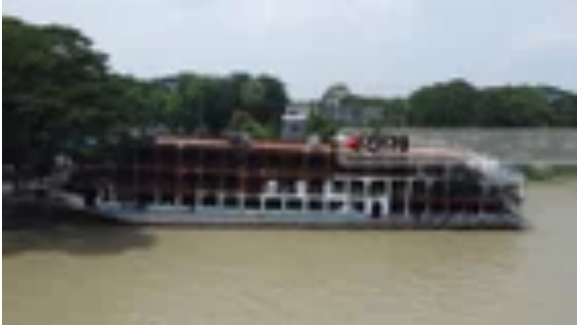
সুগন্ধা ট্রাজেডির ৩ বছর: এখনো দগদগে প্রিয়জন হারানোর.. জাতীয়