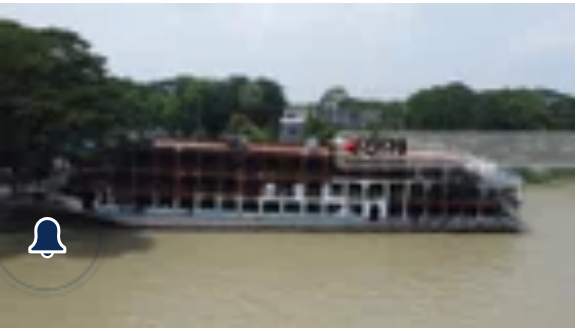
সুগন্ধা ট্রাজেডির ৩ বছর: এখনো দগদগে প্রিয়জন হারানোর.. জাতীয়