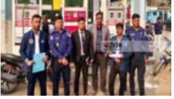
বিএসটিআই এর অনুমোদন বিহীন লোগো ব্যবহার করায় কারাদণ্ড জাতীয়