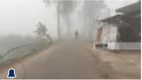
পঞ্চগড়ে বইছে মৃদু শৈত্যপ্রবাহ, তাপমাত্রা ৯ ডিগ্রিতে জাতীয়